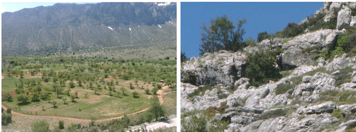
Abb. li.: Blick ins Limnakaro-Plateau von Norden aus. Abb. re.: Blick auf den Eingang der Peristeria-Höhle.

Fahrten zum Limnakaro Plateau (s. dazu auch MB 262-08): Route: 9.00 Uhr, Gouves – Stalida – Mohos (s. MB 222-07) – Tzerimiado – Kloster Kroustalenias (MB 166-06) - Agios Georgios – Limnakaro-Plateau – Ag. Pneuma - Peristeria-Höhle – Koudhoumalia – Plati – Agios Charalambos (Mittagessen [, nie wieder dort“]) – Mohos – Stalida – Gouves (13.30 Uhr) – „Siesta“ 16.00 Uhr.