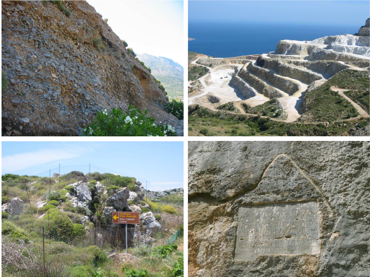
Abb. li.: Latsidi Cave nahe Sitanos; Koord. N 35°7.359, E 26°8.977. Auf unsere geplante Begehung der Höhle, ein unterirdisches Bett eines Flusses (s. MB 194-07), mussten wir leider verzichten, da die Höhle (0,5 – 1,5 m Deckenhöhe) noch reichlich Wasser führte. Abb. re.: Gedenktafel über dem ersten Eingang zur Milatos-Höhle; selbige ist uns erst jetzt (trotz mehrmaliger Begehungen) aufgefallen; siehe dazu auch unser Merkblatt 25-04.

Gefahrenre km: 300,4 (Total: 3.045,8 km) – Wetter: Sonne pur, Temperaturen um 28 Grad. (F 2/28)