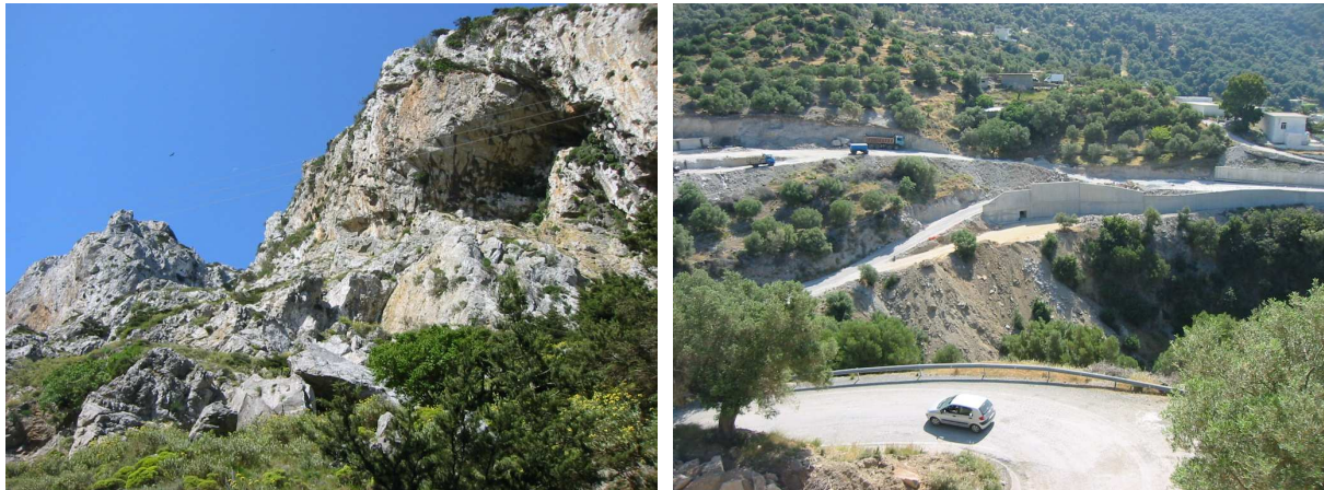
Abb. li.: am Nordende des Kotsifou-Canyon ist der Tripolitza-Flysch gut zu erkennen. Abb. re.: der „Engpass“ zwischen Kato Rodakino und Ano Rodakino (Brücke über die Schlucht aus dem Mount Krioneritis) wird durch eine neue, breitere Brücke und Straße entschärft.

Route: 8.00 Uhr – Gouves - Iraklion – Rethymnon – Richtung Spili – Agios Vasilios – Kotsifou Canyon (s. MB 56-04) – Sellia – Rodakino – Frangokastello (s. MB 99-08) – Agios Nektarios. 16.15 Uhr zurück über Kommitades (s. MB 316-09) - Hora Sfakion – Imbros (s. MB 261-08) Askifou – Vrysses – Georgioupoli – „Petres“ (s. MB 211-07) - Gerani (s. MB 15-04 und 244-08) Rethymnon – Iraklion – Gouves (19.00 Uhr). 20.00 Uhr Abendsnack bei „Philipos“.