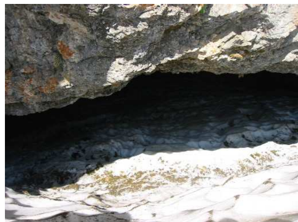
Abb. li. der Eingang zur Ideon Andron (Idäische Zeus-Höhle) war am Exkursionstag nicht zugänglich und durch ein ca. 15 m hohes Schneebrett verdeckt. Nur ein schmaler Spalt, s. Abb. re. , erlaubte uns nach Übersteigung des Schneebrettes einen Einblick in den Höhlenvorraum. Koordinaten: N 35° 12,51; E 24 ° 49,72.; Höhe: 1540 m.

Gefahrenre km: 273,1 (Total: 1.837,1 km) – Wetter: Sonne & Wolken, Temperaturen 23 Grad. (F 3/20)